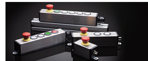
壁面およびプロフィール取り付け用アッセンブリ済み ステンレス製ボックス