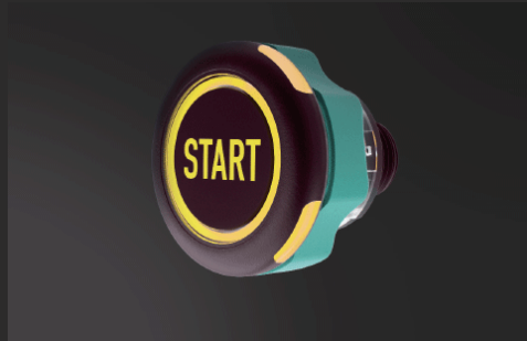
視認性が高く操作性が良い