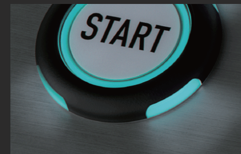
明るさや感度を自由に設定可能