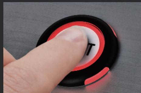
可動パーツが無く、 堅牢で高耐久