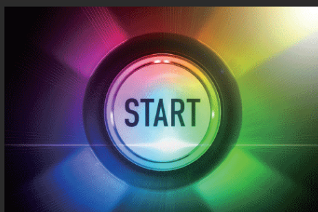
1,600万色のモダンなデザイン