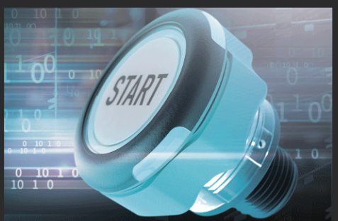
スイッチ時の動作を 自由にプログラミング